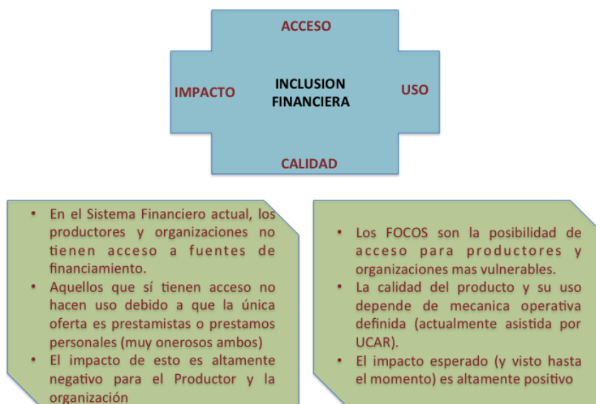
Figura 1: inclusión financiera a través de fondos rotatorios

9. El Círculo Virtuoso de los FOCOs. El proceso de inclusión financiera, conforme menciona la bibliografía reciente, contempla a) el acceso; b) el uso; c) la calidad y d) el impacto. Los FOCOs cumplen con esta línea directriz plenamente. Así, la mayor parte de los productores y las organizaciones previas a la intervención de la UCAR a través de los programas no tenían acceso, previo a la intervención, a fuentes de financiamiento, o en los escasos casos de organizaciones con cuentas bancarias el servicio de crédito es inalcanzable o no preparado para la actividad (crédito de consumo). Los FOCOs han permitido a los productores y sus organizaciones acceder a una fuente de financiamiento de bajo costo (por autogestión) y que permite a los productores utilizar el crédito de manera integrada a su estrategia productiva, evitando depender de los proveedores de insumos o de los compradores acopiadores, que habitualmente aprovechan la situación para cobrar tasas que dificultan la rentabilidad del negocio. El impacto de los FOCOs no está dado sólo por la disponibilidad y las mejores condiciones del financiamiento, sino también por la externalidad positiva que genera la educación financiera en organizaciones que no tienen este tipo de experiencia y la construcción de capital social en la organización a partir del uso de la herramienta financiera.