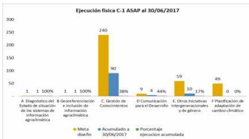
Gráfico Nro. 2: Ejecución Componente 1 ASAP

28. Las actividades de giras de intercambios y sistematización están planificadas en el POA 2017 pero aún no se ejecutaron; la actividad de Planificación de adaptación al cambio climático no se ejecutó, debido a la promulgación de la Ley 777 en el 2016, que instruyó a los Gobiernos Municipales la elaboración de sus Planes Territoriales de Desarrollo Integral-PTDI, donde se debían incorporar la planificación de la gestión de riesgos y la adaptación al cambio climático, quedando pendiente la forma de ejecutar esta actividad. Esta actividad puede ser ejecutada a partir de fortalecimiento de las capacidades municipales, unidades de Desarrollo Productivo y de Gestión de Riesgos, mediante la transferencia de los productos del Diagnóstico, Mapas de Riesgos y la inventariación de Buenas Prácticas y la correspondiente capacitación en su uso, como una contribución importante para la Planificación Territorial Municipal. Esto significa solamente contextualizar, ya que estaba previsto las actividades mencionadas en el diseño.