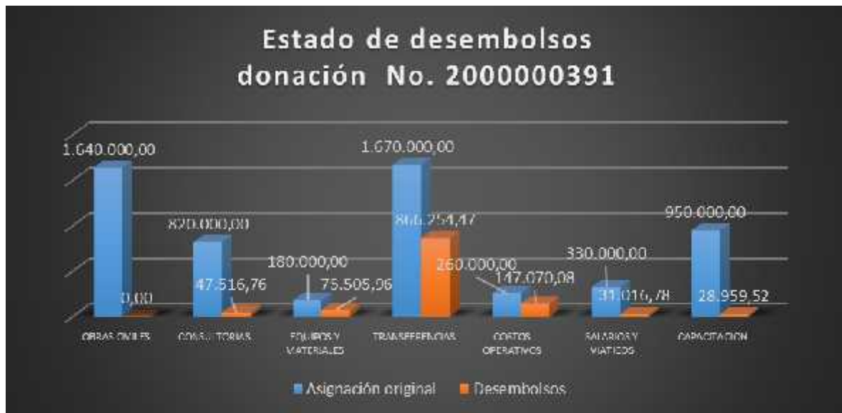
REVISIÓN DE MUESTRA DE GASTOS PROYECTO ACCESOS - ACCESOS ASSAP PERIODO DE 1 DE NOVIEMBRE AL 31 DE DICIEMBRE 2016