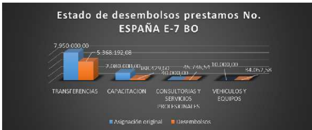
Gráfico 1: Desembolsos con cargo al préstamo y donación del FIDA, comparación entre las asignaciones originales y revisadas, y desembolsos efectivos