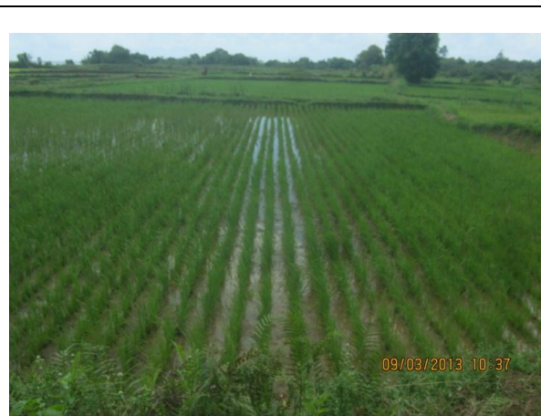
Figure 11 : Champ école paysan, SRI.