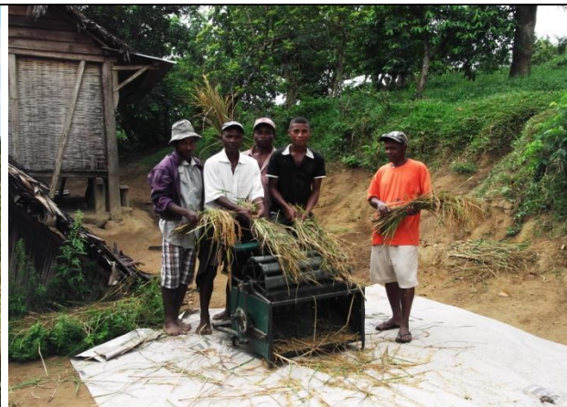
Figure 14 : Batteuse offert par le PPRR aux paysans