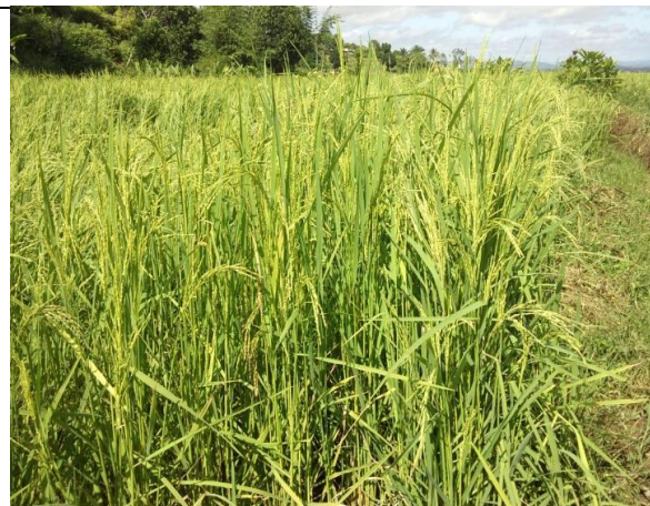
Figure 12 : Riz mûr à point.