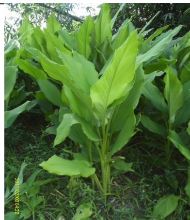
Figure 16 : Une plantation de curcuma, dans le pôle Rianila, Région ATSIANANA