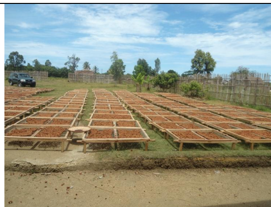
Figure 8 : Des litchis en cours de séchage, dans l'enceinte de l'Unité de transformation de la Coopérative Fanohana, Fénérive – Est (photo du mois de Novembre 2012).