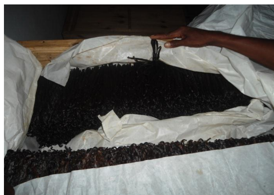
Figure 5 : Vanille conditionné en stock dans le magasin de la Coopérative Fanohana.