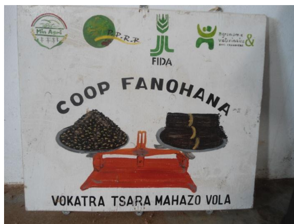
Figure 3 : Emblème de la Coopérative Fanohana