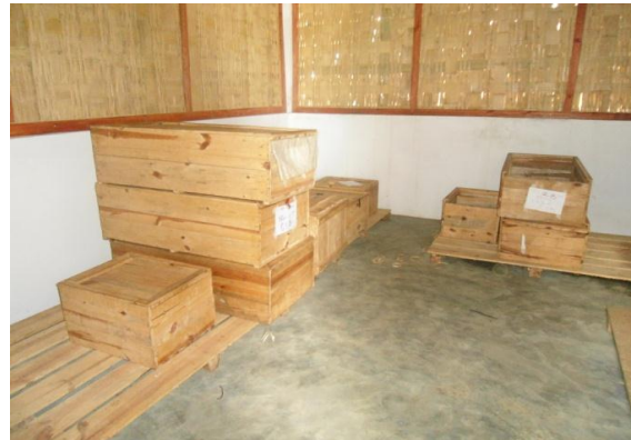
Figure 6 : Des caisses de stockage de vanille dans le magasin de la Coopérative Fanohana, Fénérive - Est.