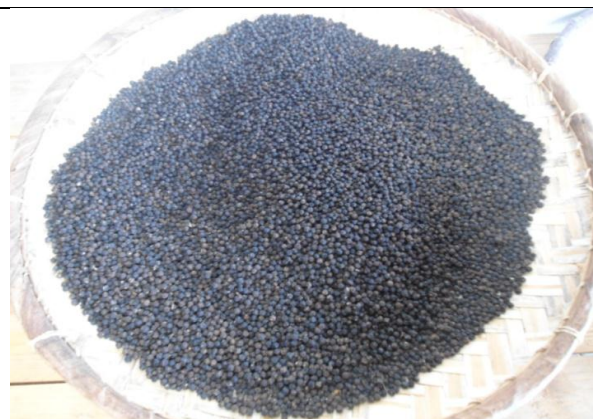
Figure 9 : Des poivres noirs en cours de séchage, Coopérative Fanohana, Fénérive - Est.