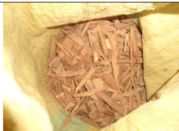
Figure 7 : Des écorces de cannelle séchées, dans le magasin de la Coopérative Fanohana, Fénérive - Est.