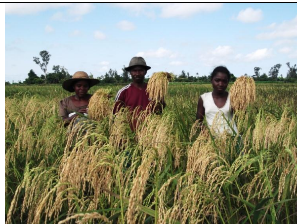
Figure 13 : Paysan encadré par le Programme, commençant les récoltes.