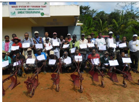
Figure 10 : Photo des paysans ayant gagné lors du concours agricole de riz, Pôle Izafo Nord.