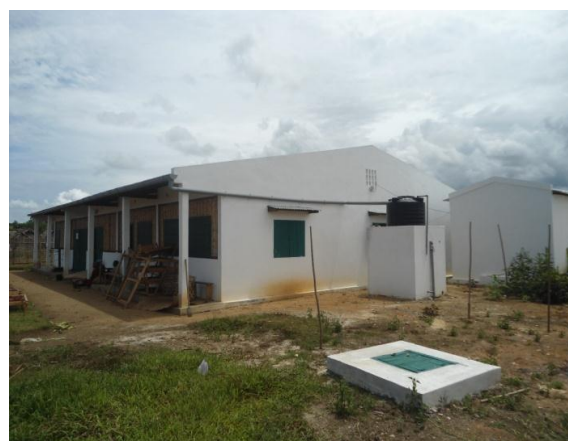
Figure 4 : Le Bâtiment servant d'Unité de transformation d'épice de la Coopérative Fanohana, Fénérive – Est.