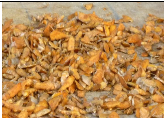
Figure 1 : Curcuma en cours de séchage, produit phare du CAM d'Anivorano Est, Pôle Rianila, Région ATSIANANANA