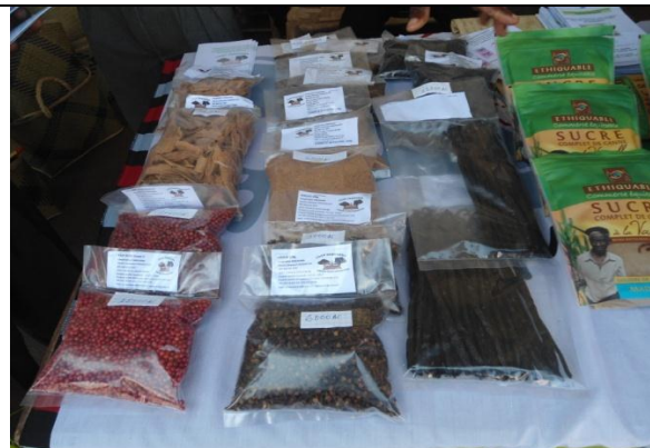
Figure 2 : Produits des Coopératives Fanohana et de PAACO exposés lors d'une Foire.