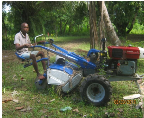
Figure 15 : Motoculteur offert par le PPRR aux paysans pour accompagner la stratégie d'intensification, dans le cadre de l'opération riz.